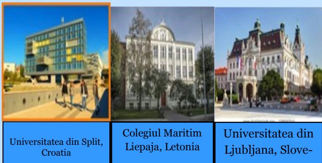
Universitatea din Split, Croația