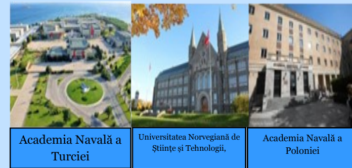
Academia Navală a Turciei

Această acțiune permite personalului administrativ, didactic și nedidactic al ANMB să desfășoare un stagiu de formare într-o întreprindere sau o instituție de învățământ superior participantă la program, cu care ANMB are acord bilateral.